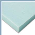
CoolGel Support Foam CoolGel高機能涼感海綿