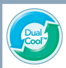
DualCool Technology™ 雙重涼感科技