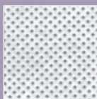
Anti-microbial Non-Woven Fabric 表層抗菌不織布