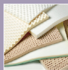
High Performance Foams 高機能泡綿