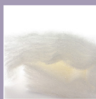
Anti-virus & Deodorant VIABLOCK Fiber 抗病毒除臭纖維