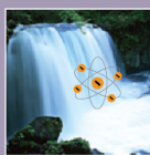
e-ION CRYSTAL® 負離子纖維